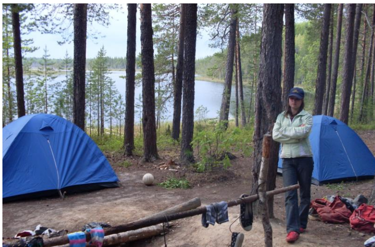
Традиционное место стоянки на берегу озера Вад