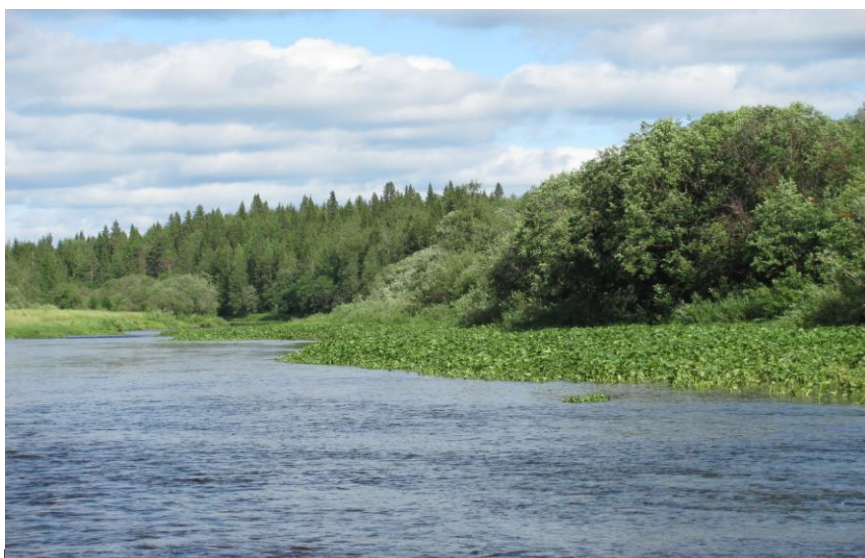
Правый берег р. Сойва: обилие перекатов.