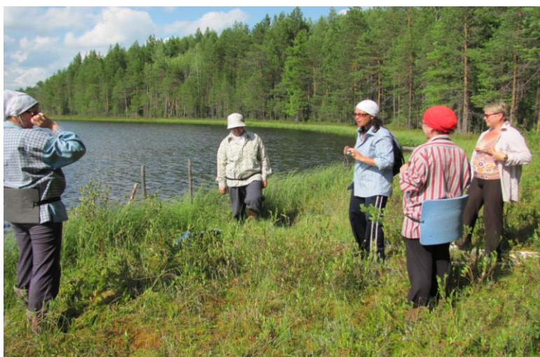
Данный маршрут пользуется популярностью у туристов из разных уголков России