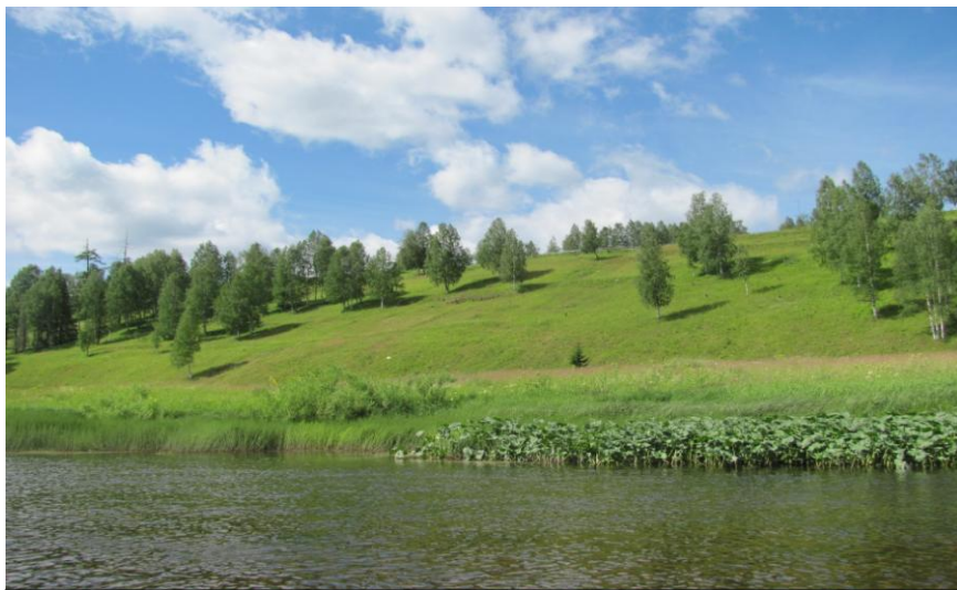
Левый живописный берег реки Сойва