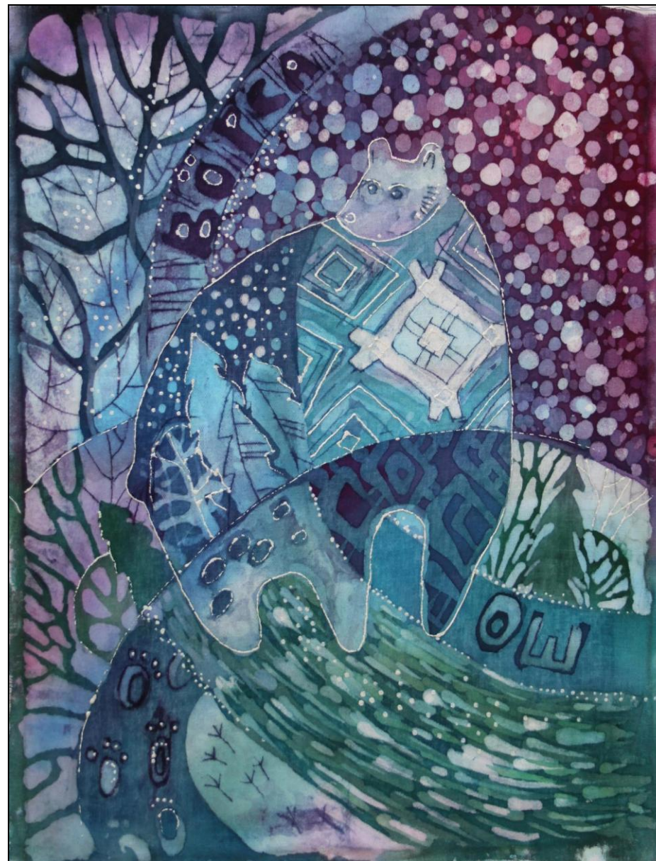
Эскиз. Медведь (Ош)