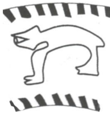
Стилизованное изображение медведя

Медведь - самый могучий и опасный зверь обширной лесотаежной зоны, обладающий к тому же большим внешним сходством с человеком, имел особый мифологический статус в традиционном мировоззрении многих народов. У коми - зырян Ош считался сыном верховного божества Ена, вместе с которым он некогда жил на небе. Однажды медведь увидел, как одна женщина уронила половинку горошины, слез с неба на землю и съел ее. Ен рассердился и лишил его права жить на небе.