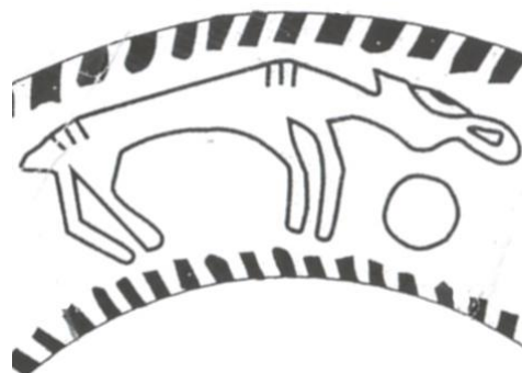
Стилизованное изображение лося

Согласно этимологическим мифам коми – зырян, лось был создан Омёлем, но Ен видоизменил его, добавив особую кость, имеющую сужение на одном конце и расширение на другом, после чего все лоси стали считаться творениями Ена. Лось - символ мужской силы и выносливости. На нём ездит фольклорный герой Кудым-Ош. Охота на лося считалась более опасной, чем на медведя: "Идёшь на медведя - готовь постель, идёшь на лося - готовь могилу и гроб". Отношение к этим двум крупнейшим представителям животного мира было во многом адекватным. Так, существовало убеждение, что убитый медведь мог ожить, пока у него не вырваны когти и не выбиты зубы, а убитый лось - пока у него не перебиты голени. Удачливым охотникам как на медведя, так и на лося приписывали безусловное благоволение лесных духов-хозяев, с которыми они находились в тесной связи благодаря своим колдовским способностям.[5]