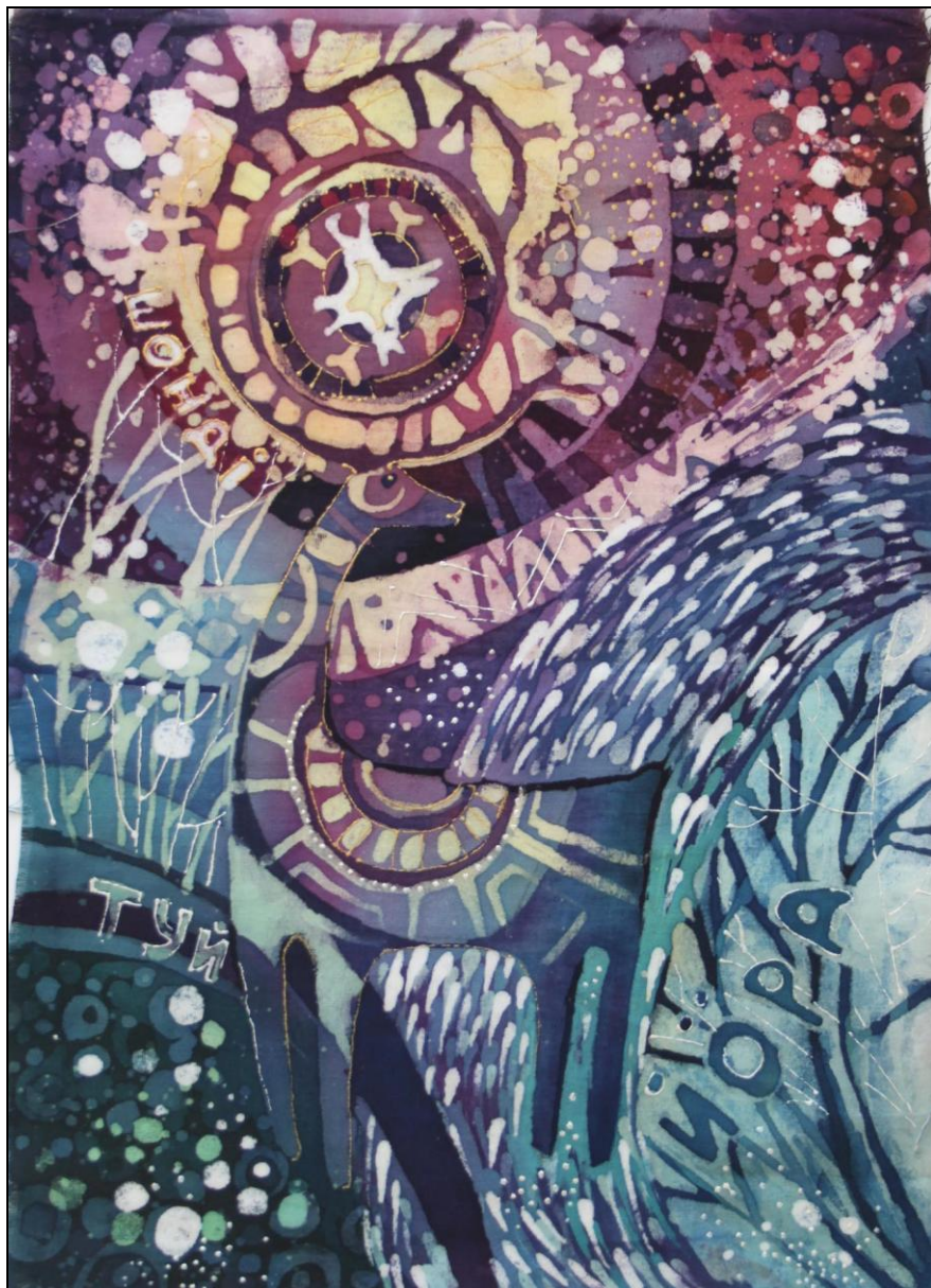
Эскиз. Лось (Йёра)