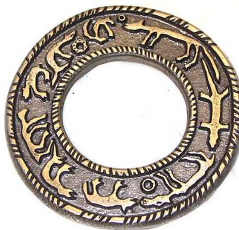
Коми промысловый календарь